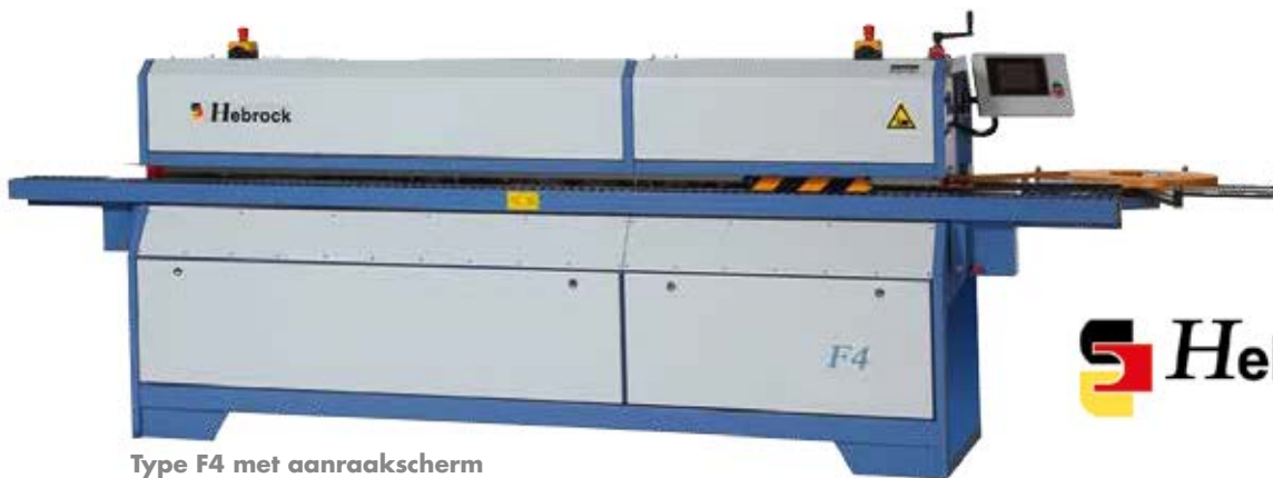
Type F4 met aanraakscherm