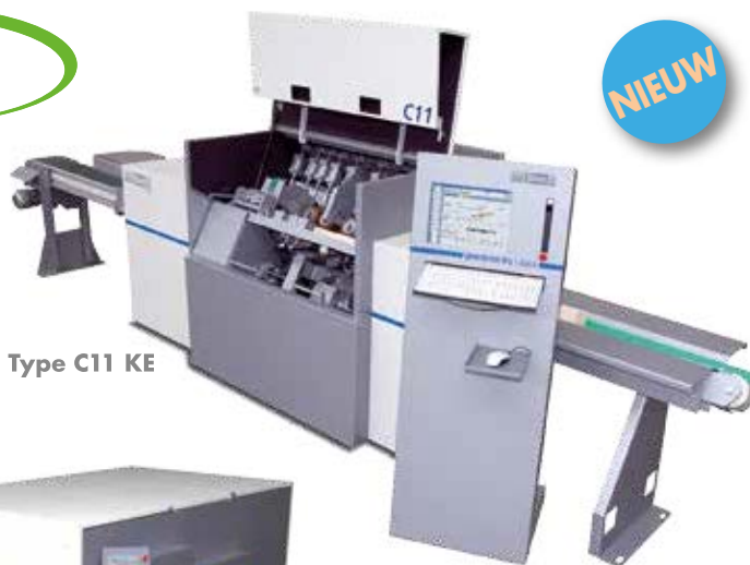
Type C11 KE

Naast deze nieuwigheid, presenteert PAUL verschillende andere kantrechtbanken en meerbladzagen, alsook een keuze hoogperformante afkortzagen.