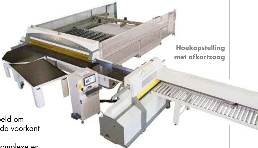
Hoekopstelling met afkortzaag

Nog een mooie vondst is de gebrevetteerde draaitafel in luchtkussenuitvoering. Deze is bedoeld om de "bottleneck" in de handling van de platen aan de voorkant van de opdeelzaag weg te nemen. Het optimalisatieprogramma legt immers dikwijls complexe en veelvuldige rotaties van platen op.